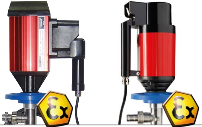
Elektrische Fasspumpe JP-400 Motor mit Pumpwerk (41 mm)