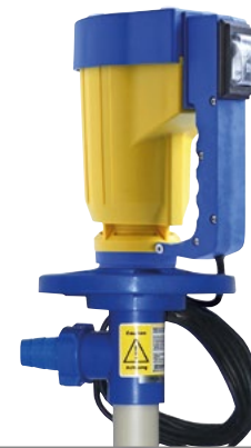
Elektrische Laborpumpe JP-120/JP-140 Motor mit Laborpumpwerk (25-32 mm)