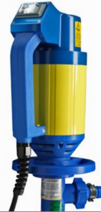
Elektrische Fasspumpe JP-160/JP-180/JP-280 Motor mit Pumpwerk (41 mm)