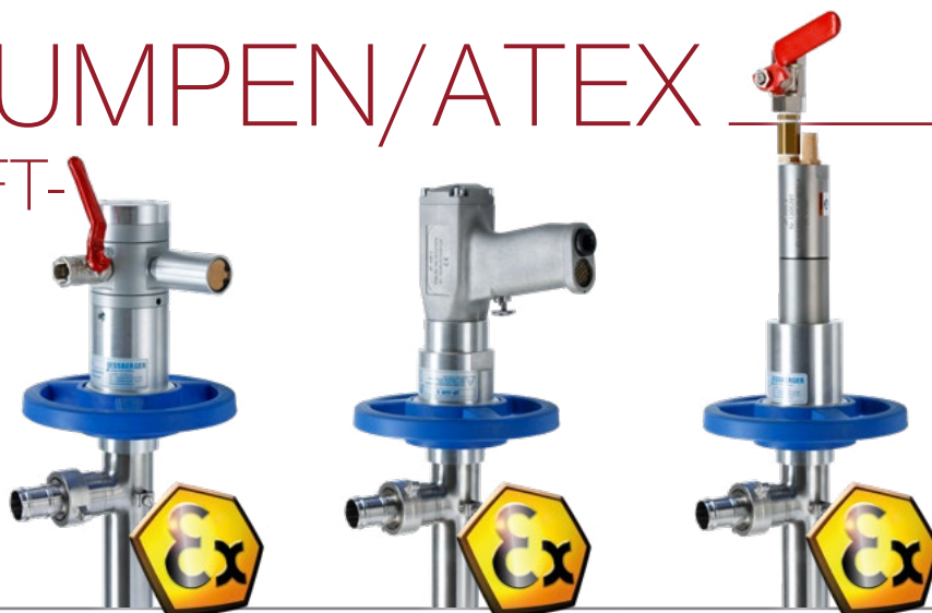
Druckluftbetriebene Fassungspumpe JP-Air 1 Motor mit Pumpwerk (41 mm)